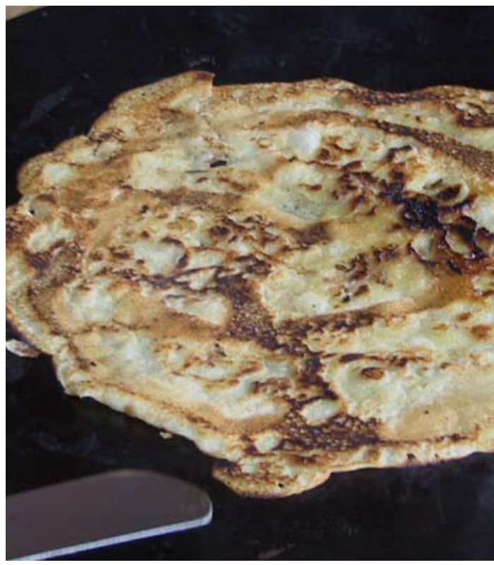
Myräkässä myydään maittavia lettuja, tule herkuttelemaan!